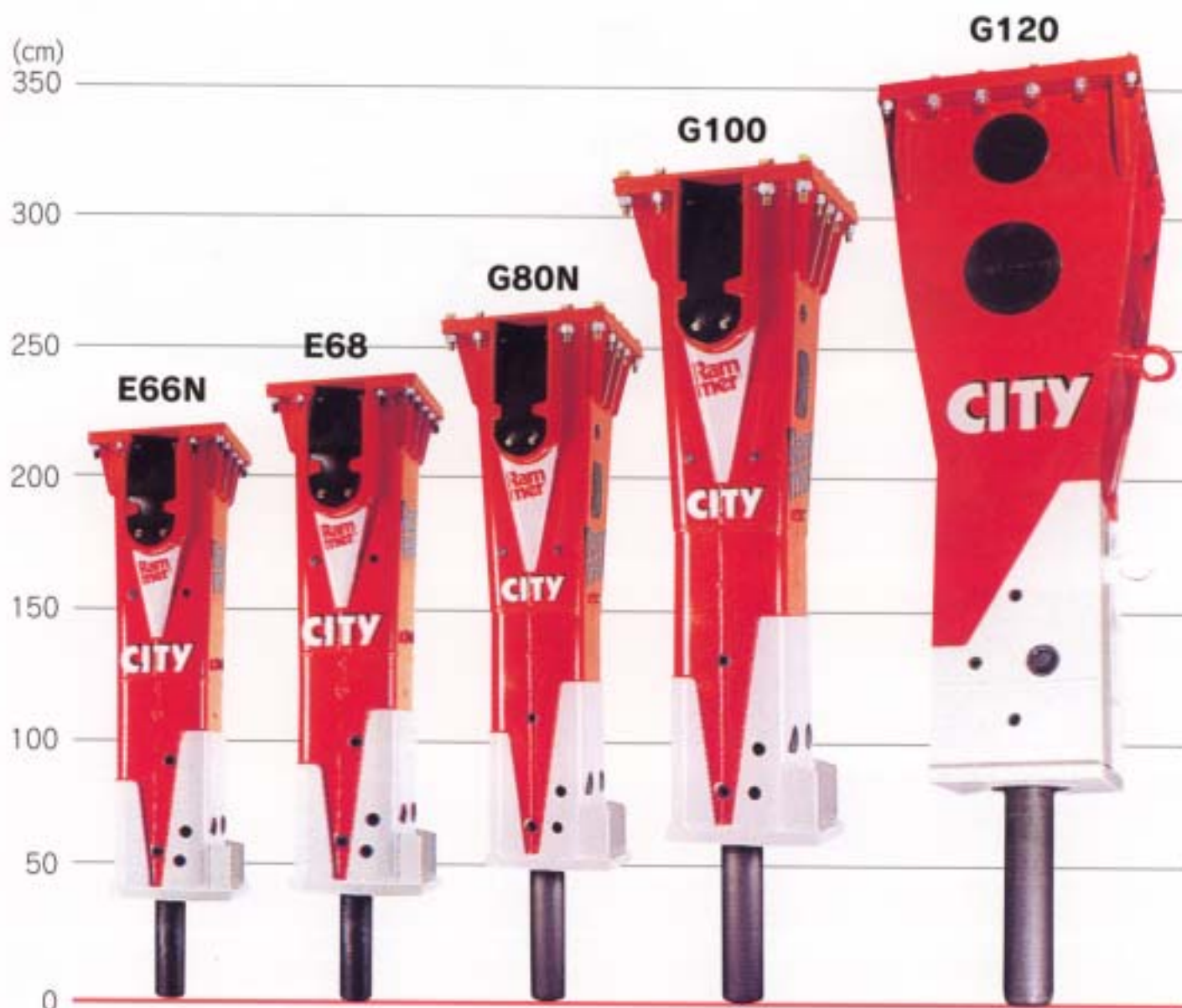
油圧ブレーカ *水中仕様もご用意できます。